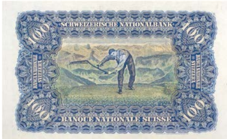
Ferdinand Hodler (1853–1918), »Der Mäher«. Rückseite der 100-Franken-Note aus der 2. Banknotenserie der Schweizerischen Nationalbank (gültig 1910-1956).